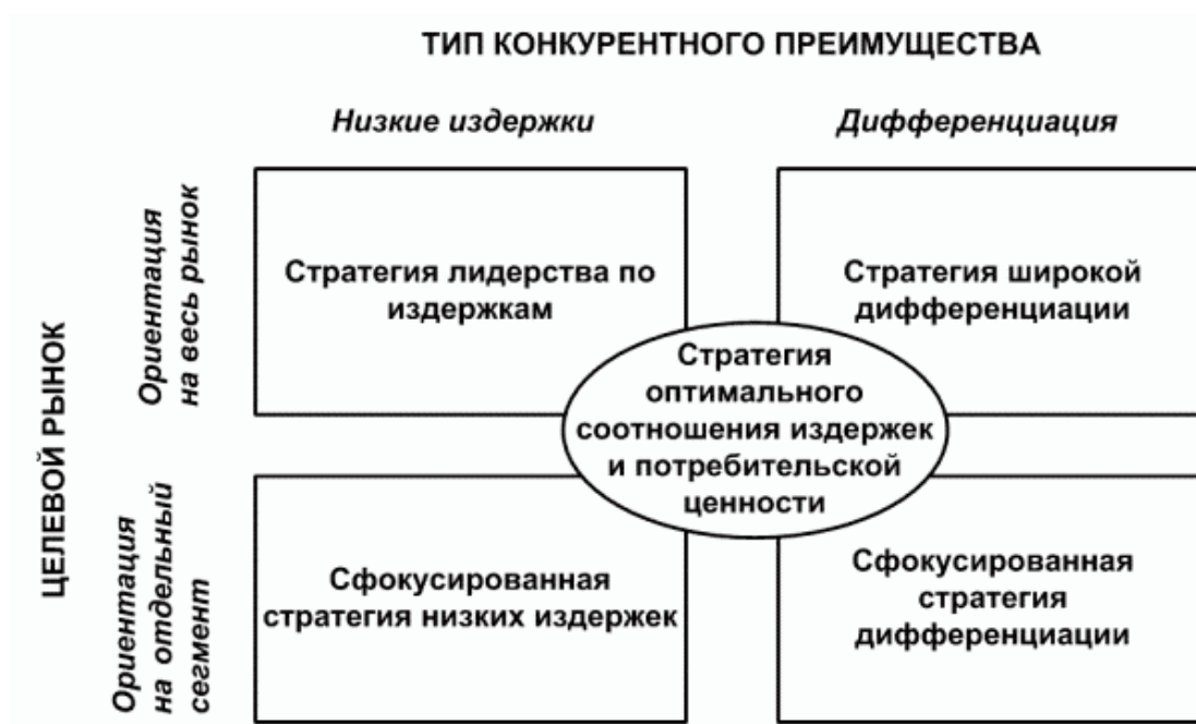
Рис. 1. Базовые стратегии по М. Портеру

Стратегия «лидерство по издержкам» направлена на достижение конкурентных преимуществ за счет низких затрат на некоторые важные элементы товара и, соответственно, более низкой себестоимости продукции по сравнению с конкурентами. Стремление и возможность производить товары с наименьшими в отрасли издержками представляет собой эффективный способ конкуренции на тех рынках, где большинство покупателей чувствительны к ценам на товары. Задача состоит в том, чтобы поддерживать преимущества перед конкурентами по затратам и получать большие прибыли.